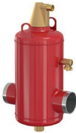
Flamcovent Smart S