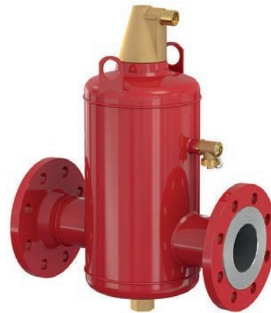
Flamcovent Smart F